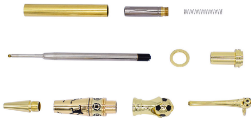
DIAGRAM A .Vist diagram er en annen penn, men samme fremgangsmåte.